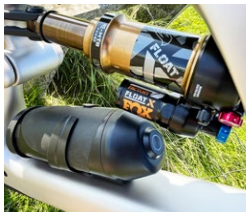
Dämpfer: „Fox Float X Factory“ + Zusatzbatterie XPro