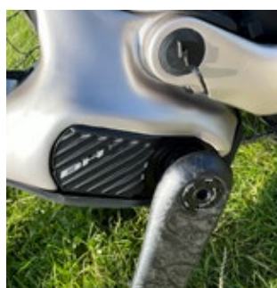
Der Motor ist mit 2,1 kg ein Leichtgewicht und bereits in der 2. Generation von BH hergestellt.