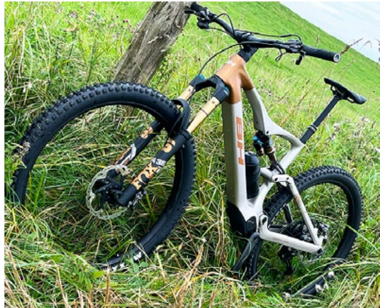
Das Team aus dem spanischen Baskenland hat die Rahmen-geometrie so designet, dass auch weniger geübte, beziehungsweise nicht ganz so schnelle Fahrer mit diesem Modell im Gelände gut zurecht kommen dürften.