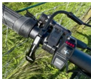
Remote-Control mit LED-Anzeige