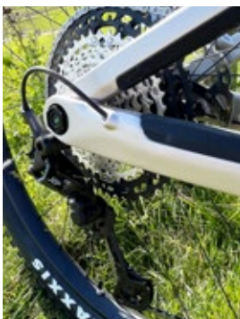
Schaltwerk: Shimano XT 12sp